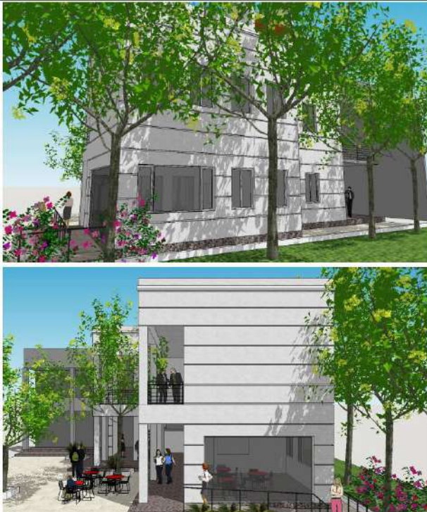
Ilustración 7. Ampliación FTyCA.

La ampliación de Facultad de Tecnología y Ciencias Aplicadas consistirá en la construcción de un nuevo módulo edilicio . El proyecto se desarrolla en dos niveles: En la planta baja se ubicará un espacio destinado a asociaciones estudiantiles y un bar con dependencias de servicio. En la segunda planta se construirá un aula-taller con capacidad para 30 personas, y los laboratorios de Hidrología y Sedimentología . La nueva construcción agregará 200 m 2 a la superficie funcional de la Facultad. La inversión estimada del proyecto es de $3.000.000,00 y se encuentra en etapa de Licitación .