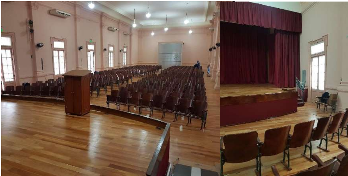
Ilustración 2. Remodelación Aula magna

El 80% de los trabajos ejecutados fueron llevados a cabo por el personal de la Secretaría General incluyendo la configuración e instalación del sistema audiovisual y la confección del nuevo telón.