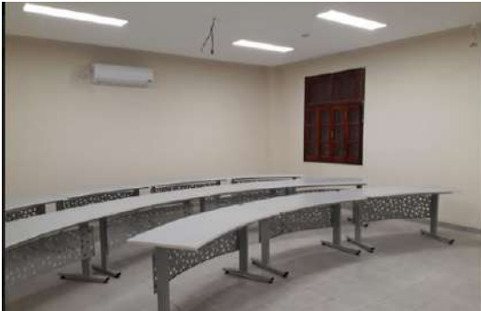
Ilustración 8. Auditorio II. Agrupamiento de Aulas II

Durante el mes de marzo se completó el equipamiento de los dos auditorios de más reciente construcción, en el Agrupamiento de Aulas II . Ambos espacios, destinados al uso común de toda la Comunidad Universitaria , se aprovisionaron con video proyectores de alta definición, pantallas desplegadas, sistema de sonido, conexión de internet de alta velocidad, cortinas y pupitres y mesas de