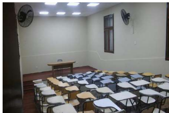
Ilustración 10. Auditorio Virgen del Valle

La intervención en el Auditorio Virgen del Valle incluyó el replazo total de pisos, reparación y pintado de muros, reconstrucción del escenario, y equipamiento con sillas/escritorio y ventiladores y AC. Actualmente, se encuentra disponible para uso común de las Unidades Académicas y tiene capacidad para 70 personas.