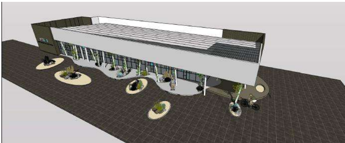
Ilustración 16. Perspectiva Comedor Universitario

El Comedor Universitario brinda servicio durante los cinco (5) días hábiles de la semana, en seis turnos diarios. La asistencia al Comedor de todos los estudiantes de la Comunidad Universitaria se encuentra subsidiada por la Universidad, que solventa el 60% del precio de cada comida. Los beneficiarios del Programa de Becas Comedor asisten en forma completamente gratuita. También concurren habitualmente el personal docente y no docente de la Universidad. En su funcionamiento diario el Comedor presta atención a un promedio 520 personas.