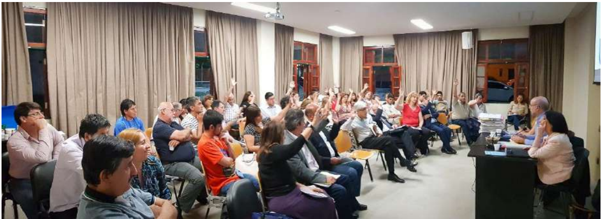
Ilustración 9. Auditorio I. Agrupamiento de Aulas II