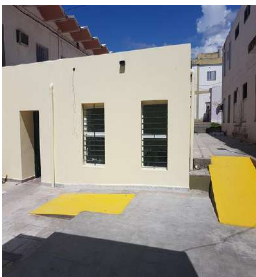
Ilustración 13. Ampliación IDI

Durante el mes de marzo se concluyó la ampliación Instituto de Informática de la Facultad de Tecnología y Ciencias Aplicadas . La obra incluyó la incorporación de 2 nuevas aulas con capacidad para 40 alumnos respectivamente y un box docente . Estos nuevos espacios fueron provisionados con equipamiento informático y de redes , y serán destinados a actividades de académicas y de investigación en el campo de las Tecnologías de la Información y de la Comunicación. La ampliación incorpora a 100 m 2 cubiertos al espacio útil de la Universidad y representa una inversión de $ 750.000.