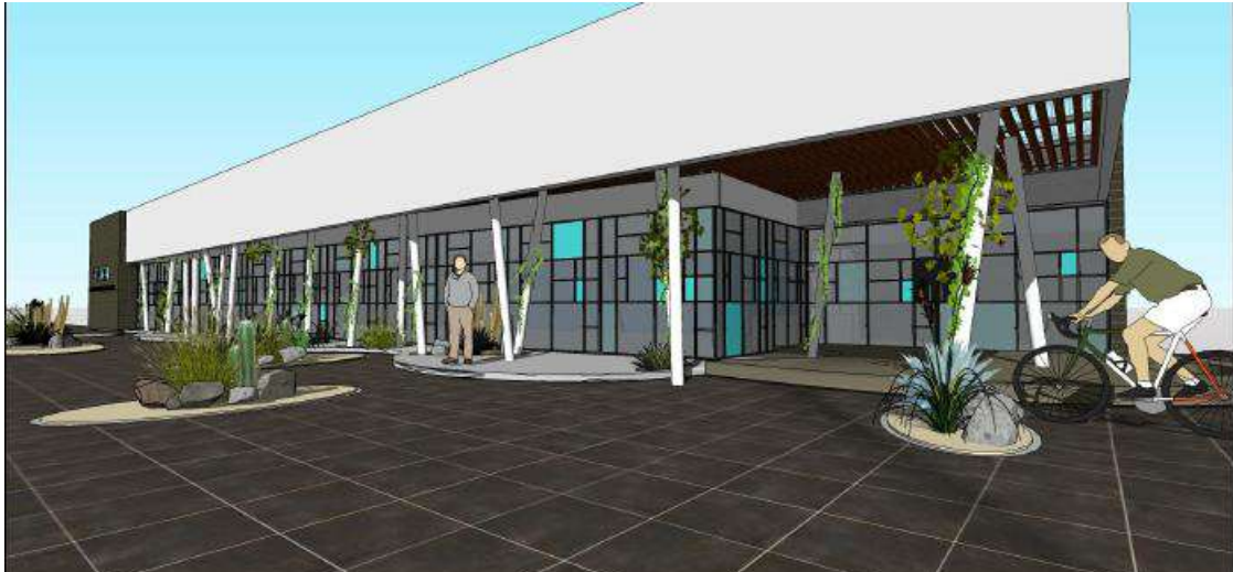
Ilustración 15. Perspectiva Comedor Universitario

En el mes de octubre se iniciará la construcción del Comedor Universitario en el nuevo sector del Predio Universitario ubicado frente a la Plaza del Aviador. El edificio, de 520 m 2 , contará con espacio de comedor , acondicionado y equipado para albergar a 210 comensales . Además, dispondrá de sector cocina, cámara de frío, depósito, zona de lavado y demás espacios requeridos para la preparación del servicio.