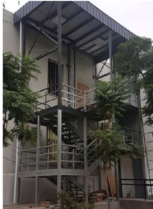
Ilustración 11. Escalera FCEyA

En el caso de la Facultad de Ciencias Económicas y de Administración (FCEyA) , ubicada en el segundo nivel del Edificio Pabellón General Herrera del Predio Universitario de la UNCA , se intervino sobre la accesibilidad arquitectónica y el sistema de evacuación de sus instalaciones.