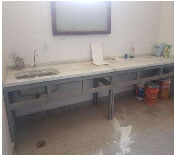
Ilustración 12. Etapa de ejecución de obra. Laboratorio de Suelo.

requeridas para el desarrollo normado de actividades de investigación en la materia.