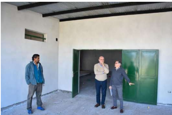
Ilustración 4. Recorrido Obra Sede Los Altos

exposiciones de artesanos y productores locales y actividades culturales diversas .