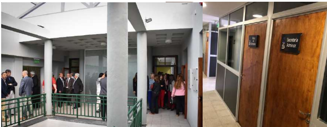
Ilustración 5. Ampliación FCS

También se edificó un sector de oficinas administrativas , el Decanato de la Facultad y dependencias de servicio (sanitarios, sanitario accesible, kitchenette).