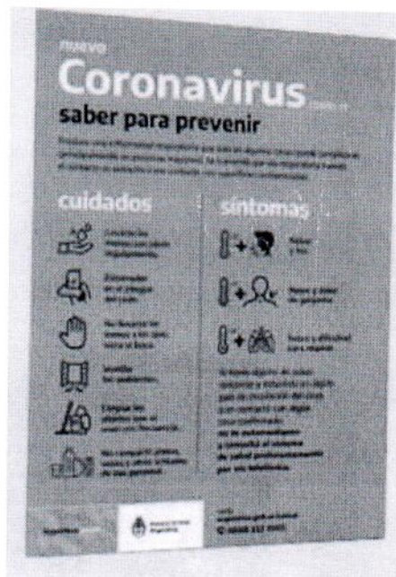
Figura 1: Afiche modelo a colocar en lugares visibles

En todo momento se pondrá a disposición del personal y demás concurrentes a los actos licitatorios información sobre la adecuada higiene de manos y la apropiada higiene respiratoria o manejo de la tos ante la presencia de síntomas de una infección respiratoria.